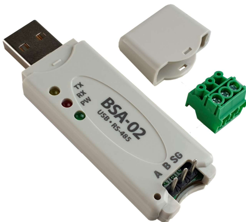
Рисунок 1 - Адаптер USB BSA-02